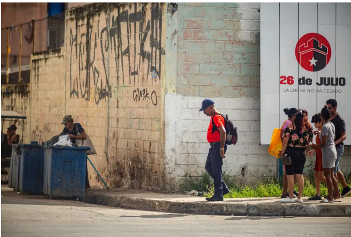
Imagen referencial.

La situación actual de Cuba no solo define el futuro inmediato de su población, sino que representa un caso de estudio sobre la sostenibilidad de los regímenes totalitarios en el hemisferio occidental, publica en Diario Las Américas de U.S.A que compartimos con ustedes.