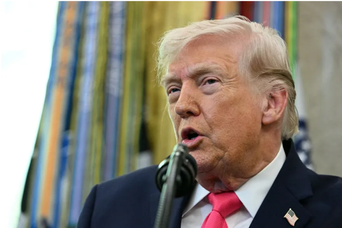
El presidente Donald Trump.

"Será mejor ponerse en serio rápidamente antes de que sea demasiado tarde, porque cuando ocurra eso, ¡NO HABRÁ VUELTA ATRÁS y no será nada bonito!", advirtió Trump